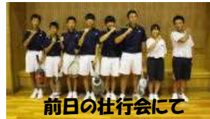
前日の壮行会にて

3年生にとっては最後の試合でしたが、どのペアも全力を尽くして頑張りました。暑い中、一生懸命頑張った青春の1ページ。今後の人生にきっと生かしていってくれることでしょう。